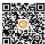
城关区医保局二维码

体检人员可先下载“掌上体检APP”，在前台预留本人的姓名和手机号码。体检电子版报告完成后，会短信通知您登录APP查询体检结果。